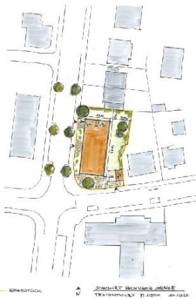
Testentwurf Hechinger Straße