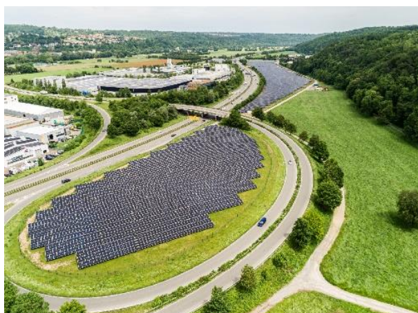
Solarpark Traufwiesen