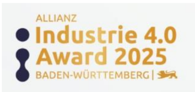
Logo: Allianz Industrie 4.0 Award

Nutzen Sie jetzt die Gelegenheit, sich selbst oder herausragende Ausbilderinnen und Ausbilder Ihres Unternehmens für den Landesausbilderpreis 2025 vorzuschlagen. Der Preis würdigt Personen, die sich mit ihrem Engagement in der beruflichen Bildung besonders hervorgetan haben. Er wird vom Ministerium für Wirtschaft, Arbeit und Tourismus Baden-Württemberg in Zusammenarbeit mit dem Handwerkstag BW, dem Industrie- und Handelskammertag des Landes (BWIHK) sowie dem Landesverband der Freien Berufe (LFB) vergeben. Bewerbungsschluss ist der 31. Januar. https://landesausbilderpreis.gut-ausgebildet.de/