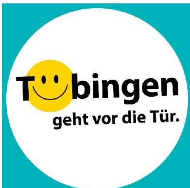
Grafik: HGV Tübingen