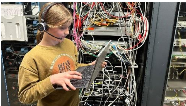
Bild: Girls' Day