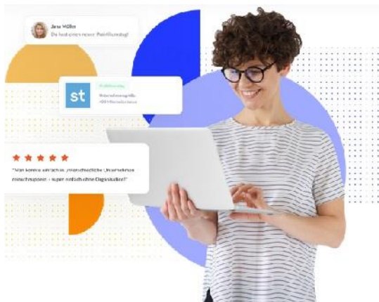
Bild: Praktikumswochen in Baden-Württemberg