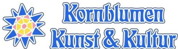
Logo: Kornblumen – Kunst & Kultur