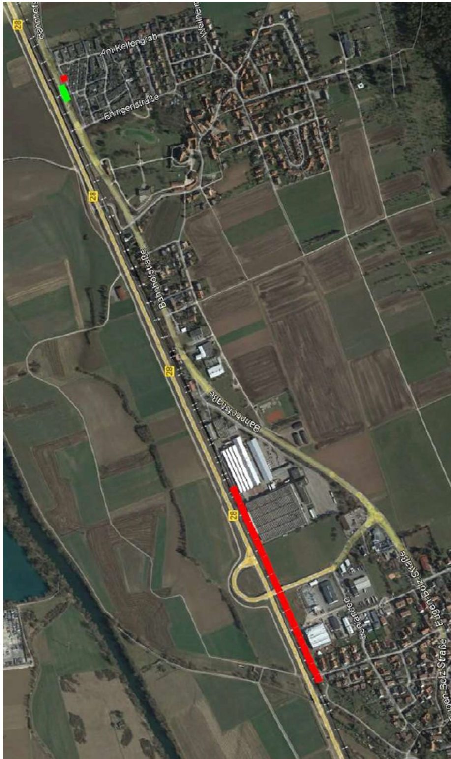
Kilchberg und Bühl