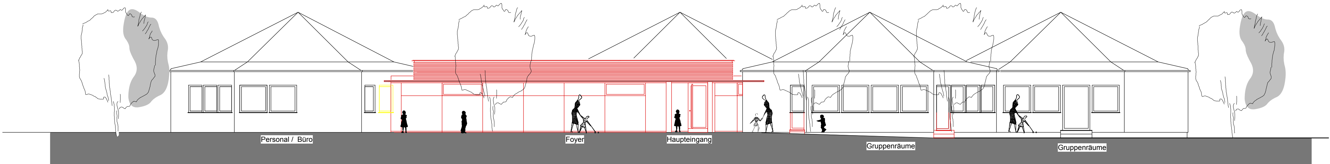
ANSICHT WEST HAUPTINGANG M 1/100