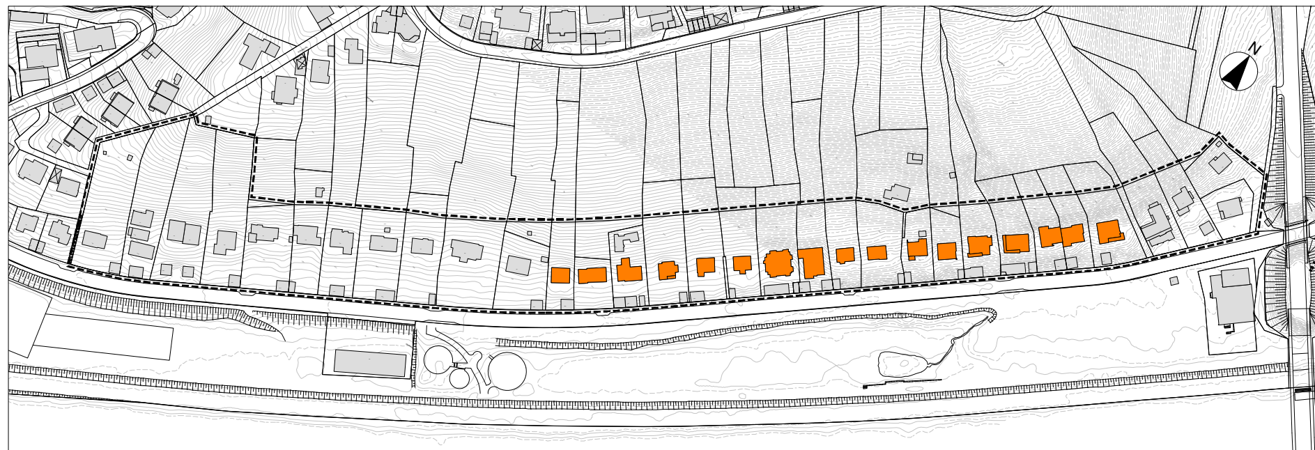
Gebäudestandort hangabwärts - Teilbereich Ost