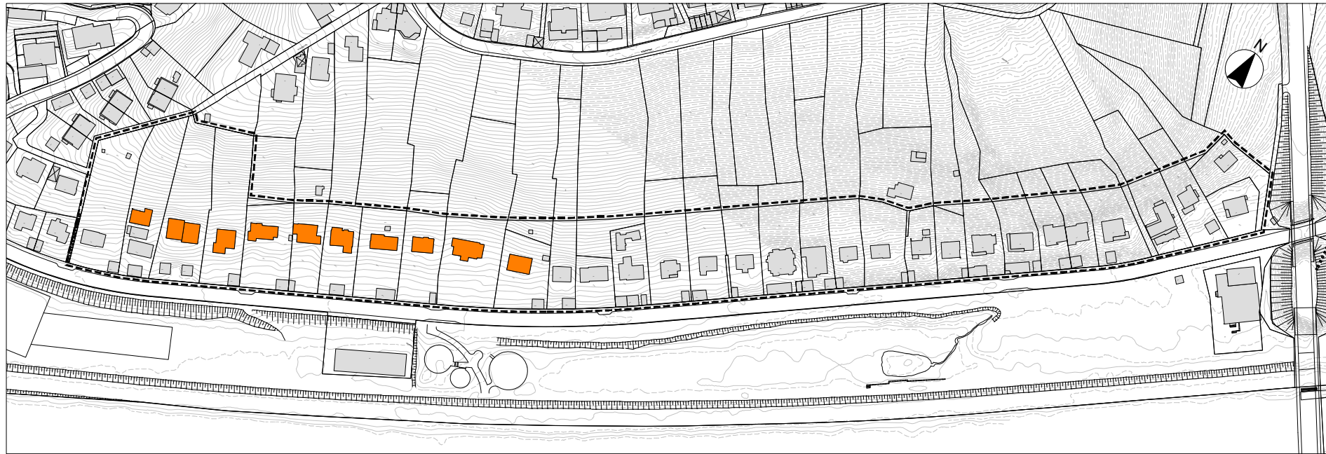
Gebäudestandort hangaufwärts - Teilbereich West