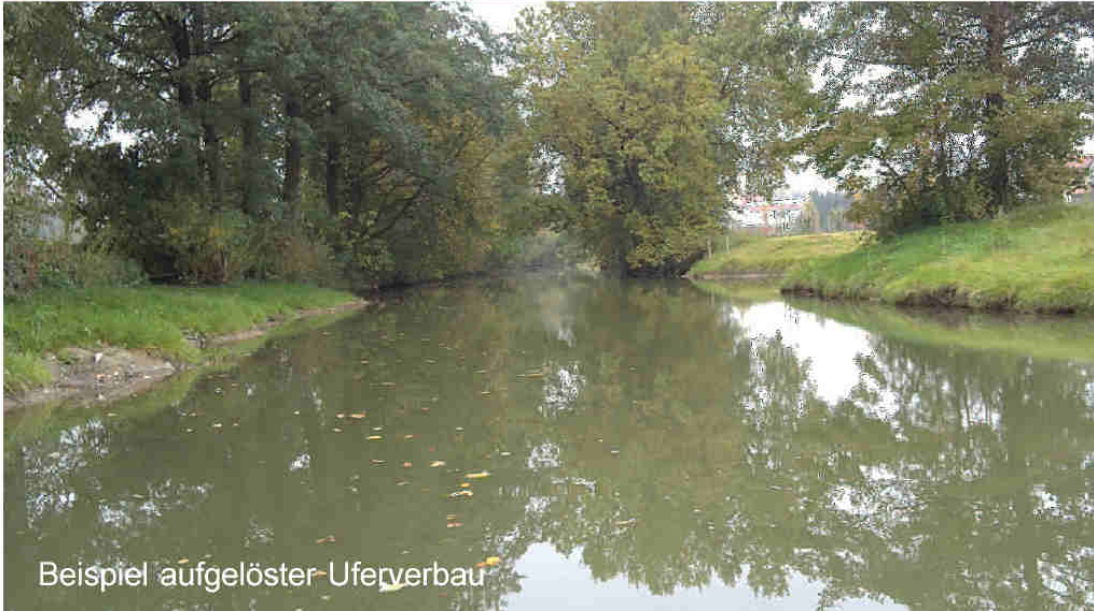
Beispiel aufgelöster Uferverbau