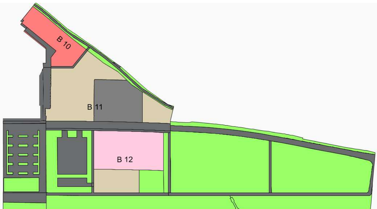
Abb. 1: Der Flächenbilanz für den Umweltbericht vom 15.03.2011 zu Grunde liegendes Flächenlayout (Ausschnitt des zu ändernden Bereichs)

Im Folgenden werden die Aussagen des Umweltberichts vom 15.03.2011 zu den Umweltauswirkungen für die einzelnen Schutzgüter hinsichtlich der geplanten Änderungen überprüft.