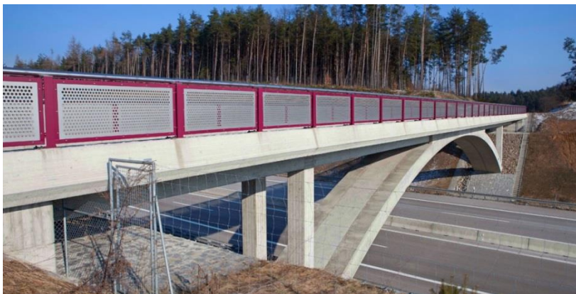
Ansicht Stahlbetonbogenbrücke IB bulicek, München