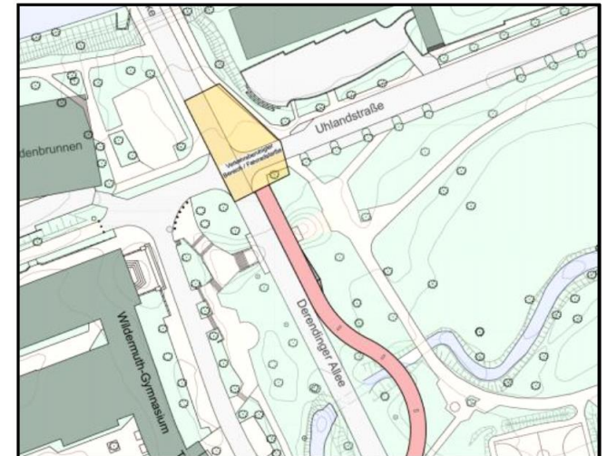
Entwurf Sobek und tragwerke+