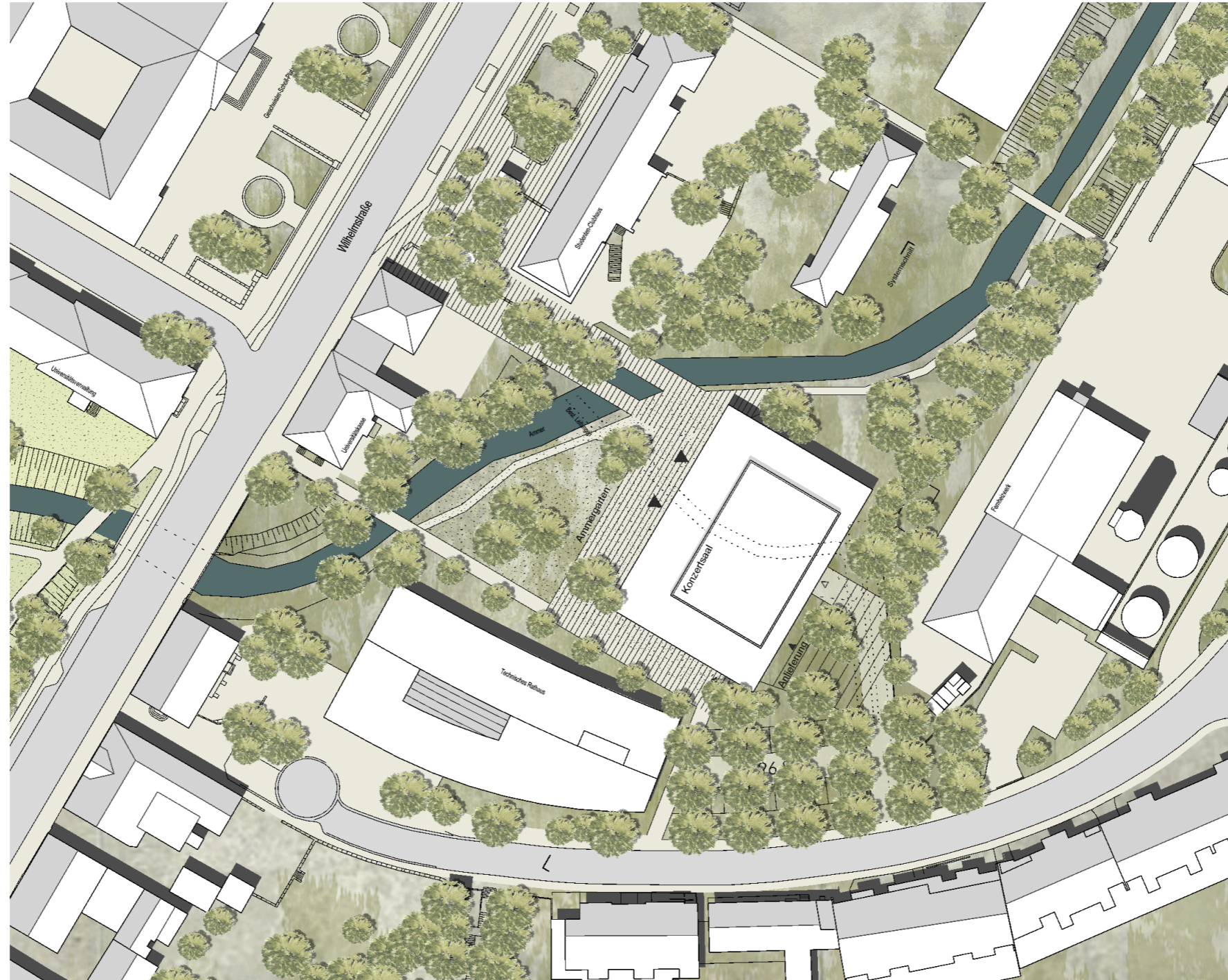
Lageplan - M 1:1000