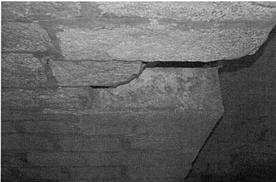
Abb.7: Schadensbild älterer Brückenbogen von 1779, von Norden. Ausbruchstelle mit zwei fehlenden Quadersteinen. Rissbildung in den Nachbarsteinen.