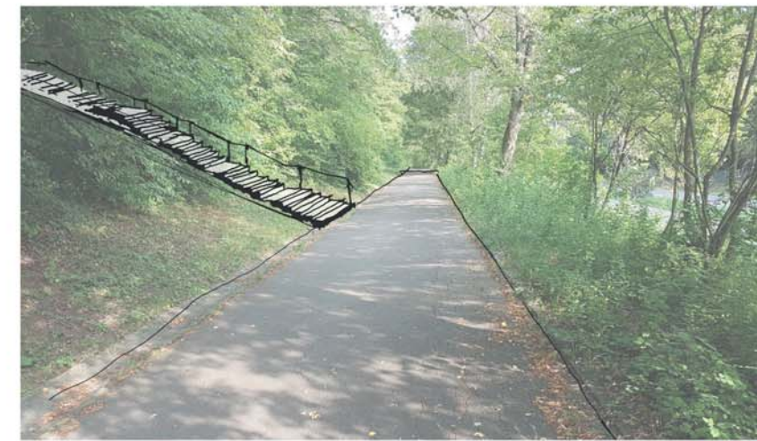
Blick vorh. Asphaltweg