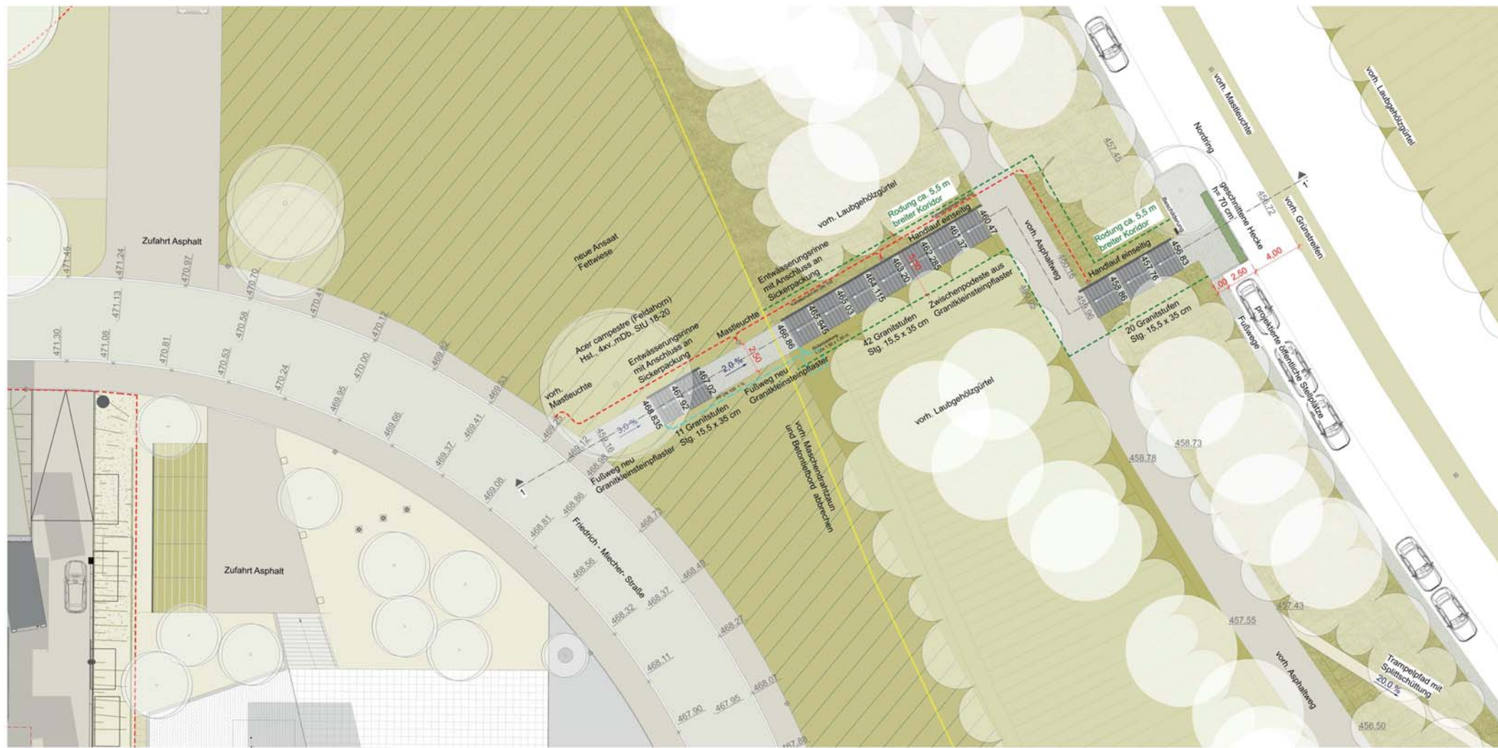
Lageplanausschnitt, M 1: 200