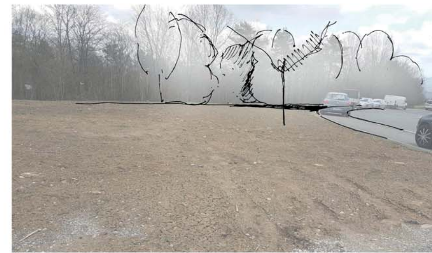
Blick Friedrich - Miescher Straße