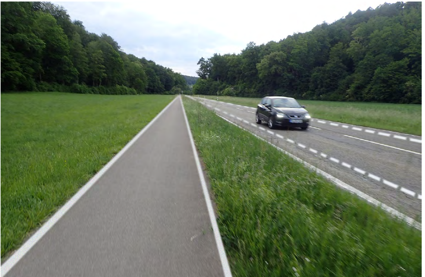
Zielzustand - Einrichtung eines Blendungstreifens damit bei nächtlichen Fahrten im Gegenlicht der Rand des Radwegs besser sichtbar ist