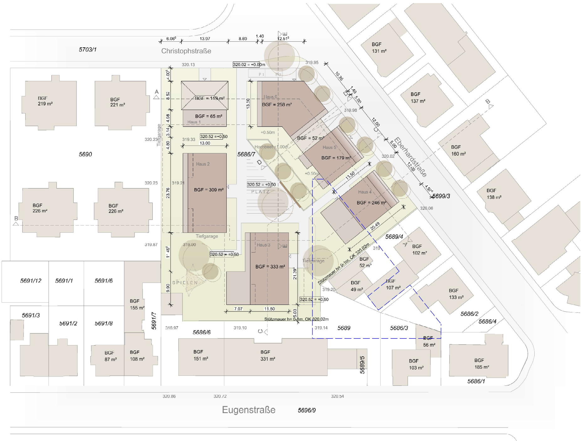
B 00.01 Lageplan

BGF= Bruttogrundfläche BGF Haus 1-Haus 6: 1.561 m² Grundstücksfläche: 4.398 m²