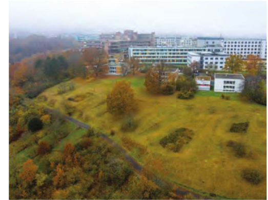
Blick von Süden