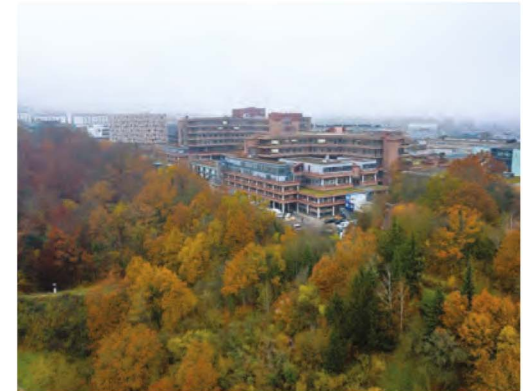
Blick von Südwesten

Die Neue Medizinische Klinik besteht aus 2 Bauabschnitten, dem 1.BA „GelenkbaU“ und einem 2. BA östlich davon, der an der Südwestecke des Campus zwischen dem Bestand CRONA B und dem Bettenhaus West einen neuen Schwerpunkt setzt: