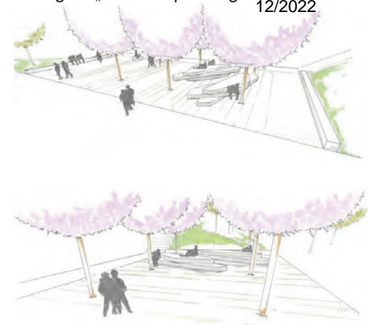
Blick über den Mensaplatz